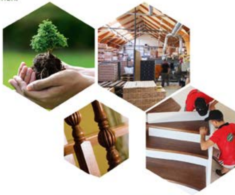
FABRIK FÜR HOLZTREPPEN

3-D-Design und Fertigung von Holztreppen nach Ihren Wünschen und Ihrem Geschmack, eine große Auswahl an fertigen Lösungen und ein flexibles Preisformat. Installation von Treppen in der Anlage gem 1 Tag. Wenn Sie knarrfreie, starke, natürliche sowie moderne Treppen wünschen, dann sollten Sie zu uns kommen.