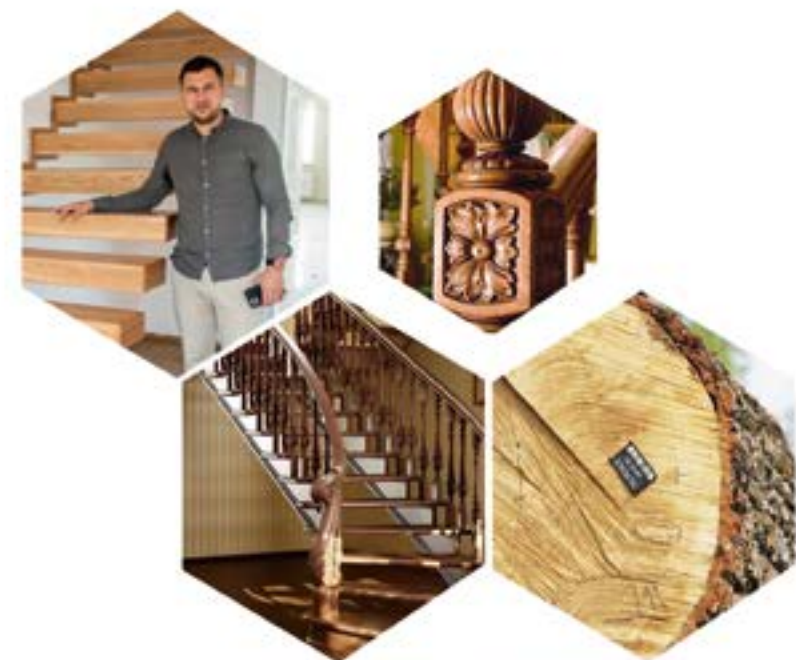
FABRIK FÜR HOLZTREPPEN

Bewährte Materialien und Technologien für maximale Festigkeit und Langlebigkeit der Produkte